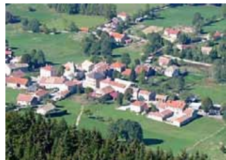
En foncé, les parcelles 811 et 812 que la commune souhaite acheter

priétaire à la commune). Les frais d'actes et tous les frais afférents seront supportés par la Commune. D'autre part, le Conseil sollicite auprès du Conseil Général de la Drôme une subvention au titre de la Dotation Cantonale 2012.